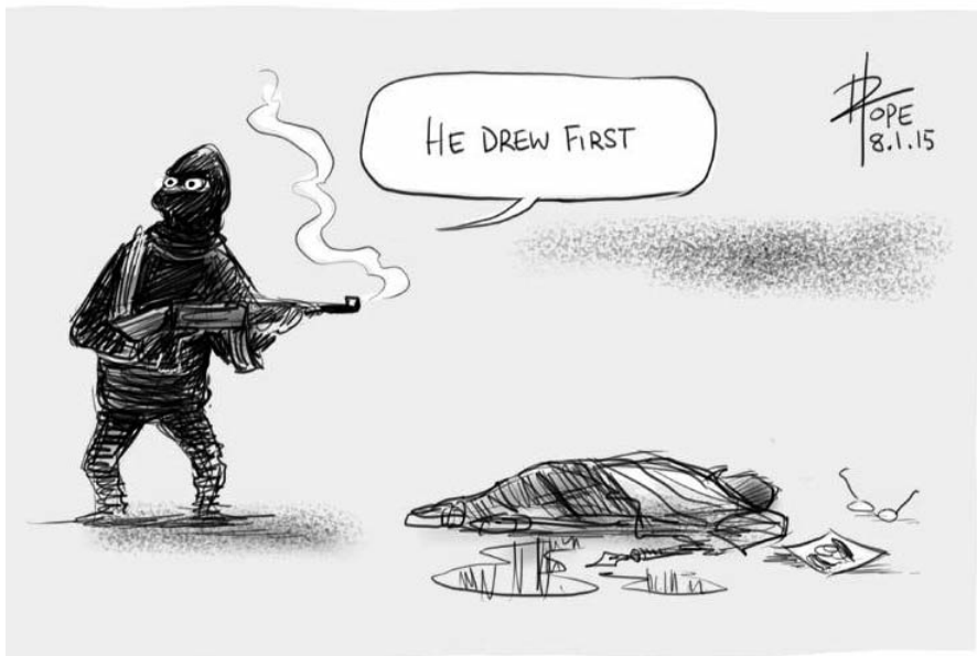
«Il a dessiné le premier»

Contre le racisme, et contre les politiques qui mettent dans la précarité des millions de personnes, il faut une mobilisation unie et massive ! C'est sur ces bases que nous participerons au soutien aux journalistes et employés de Charlie Hebdo et que